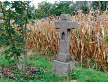
Le calvaire de la main