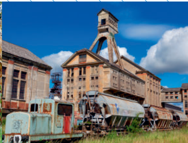
Le Carreau Rodolphe