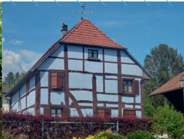
Maison à colombages, rue de la Cure