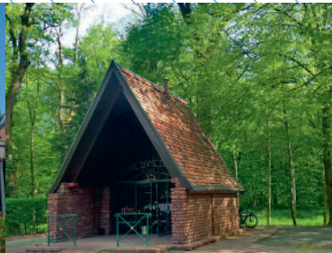
Chapelle Notre Dame du Chêne