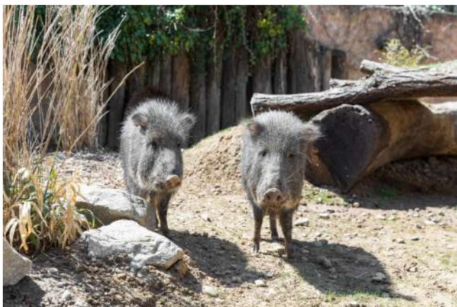
Pécaris du Chaco

Le 31 mars, le Parc zoologique & botanique de Mulhouse a accueilli trois pécaris du Chaco, une espèce qui n'était jusqu'alors pas présente au Parc. Le mâle de trois ans et les deux femelles de deux ans sont tous trois nés au Zoo de Berlin et sont désormais visibles à la mini-ferme du Parc de Mulhouse, dans un enclos aménagé pour leur arrivée. Les pécaris du Chaco font partie d'un programme d'élevage européen auquel participe désormais Mulhouse ; par l'accueil de ces trois pécaris, le Parc de Mulhouse devient le neuvième parc européen à accueillir l'espèce en vue de sa conservation. Originaire d'Amérique du Sud, le pécaris du Chaco est considéré comme « En danger » par l'UICN. La destruction de son habitat constitue la principale menace qui pèse sur l'espèce : la végétation d'origine étant remplacée par de l'herbe à pâturage, il ne reste au pécaris que peu de nourriture et l'animal se retrouve sans abris contre les prédateurs.