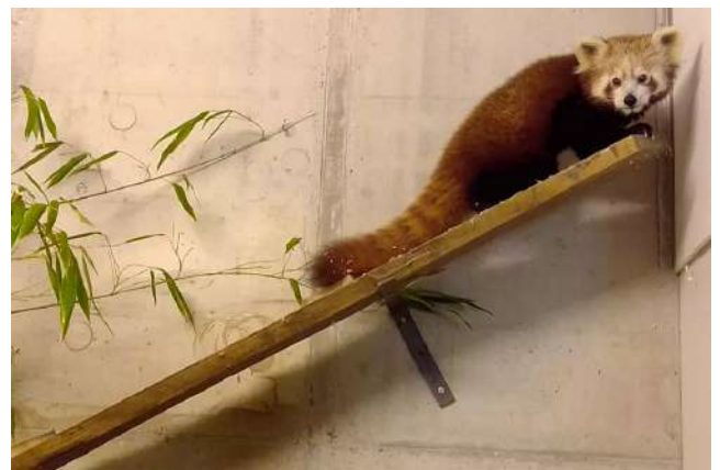
Asa, le panda roux

En avril, les deux femelles Dim et Bao ont quitté le Parc zoologique & botanique de Mulhouse, direction le Zoo de Straubing. Début mai, un jeune couple a rejoint l'enclos, avec pour objectif la reproduction. Ima, le mâle, un an, en provenance du Parc animalier d'Auvergne, a été rejoint la semaine dernière par Asa, une femelle du même âge, arrivée quant à elle de Normandie. Le panda roux, qualifié de « mammifère le plus mignon », est classé « En danger » par l'UICN et fait l'objet d'un programme européen d'élevage auquel participe le Parc zoologique & botanique de Mulhouse.