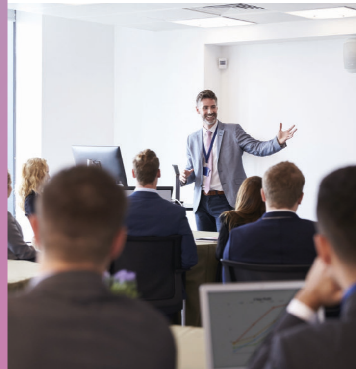
Plate-forme interministérielle des Ressources Humaines - Appui aux services de l'Etat dans la région Grand Est sur les questions d'organisation du travail, de mobilité de carrière, de gestion prévisionnelle des emplois et effectifs, de formation et d'action sociale / environnement professionnel.