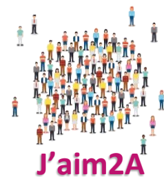
Logo créé par le groupe « Plus-value de m2A pour les habitants »