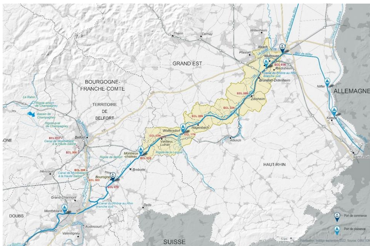
Carte 1: Le Canal du Rhône au Rhin Branche Sud et les collectivités « mouillées » [Réalisation INDDIGO]

La carte ci-dessous illustre le périmètre « touristique » pris en compte dans le cadre du présent Contrat de canal.