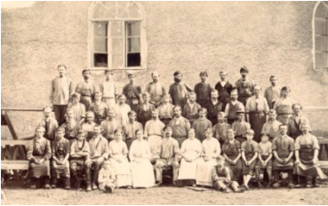
Le personnel d'un atelier en 1880