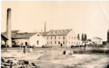
L'usine en 1880

Chaque image est accompagnée d'une fiche d'identification et de datation ainsi que des éventuelles mentions de droits d'auteur qui lui sont attachés en cas de réutilisation. Cette collection sera donc immédiatement consultable et accessible. Une histoire rétrospective de l'usine d'impression de Pfastatt le Château, rédigée par Jean-Pierre Beck, accompagnera ces documents iconographiques.