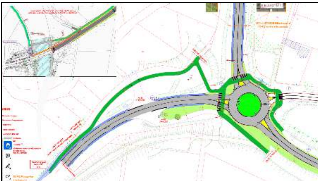
Vue de l'aménagement de l'intersection RD8bisI et RD433 avec jonction vers la voie verte existante

Aussi, le projet de convention ci-joint, propose que Mulhouse Alsace Agglomération :