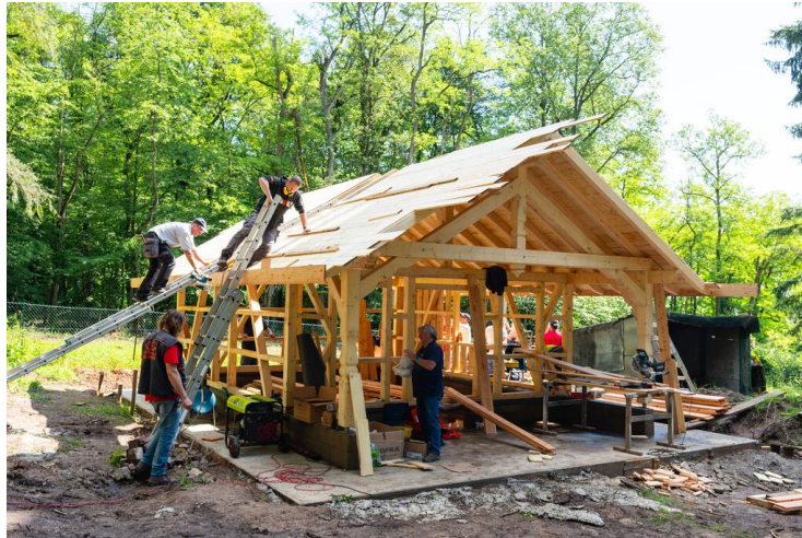
Chalet Citoyen de Berrwiller – Chantiers "Journée Citoyenne" 2024 et 2025